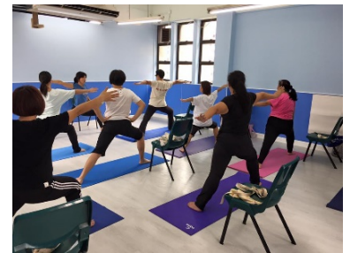
瑜珈紓壓小組讓家長享受屬於自己的時間

香港大學研究團隊持續評估由三間指定的非政府機構 - 香港明愛、協康會及香港耀能協會提供的家庭支援服務。這些服務豐富多樣，包括：認知行為療法、情緒理解辨識、正向管教技巧、瑜珈紓壓課程、布書DIY等。以透過進行問卷調查及聚焦小組，以評估服務效益，整合家長意見。