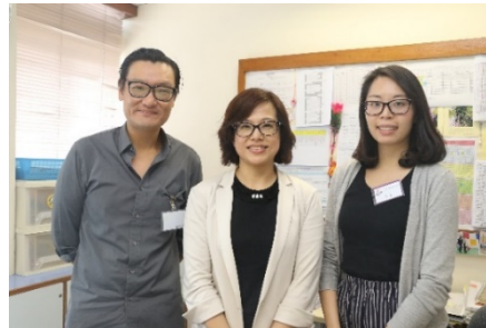
造訪東華三院徐展堂學校