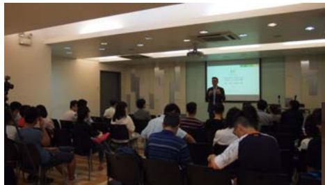
申請者向董事會介紹項目建議書